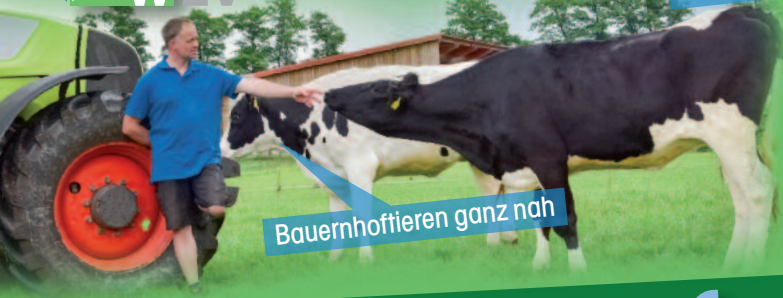
Bauernhoffieren ganz nah